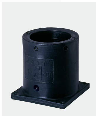
H 400 mm