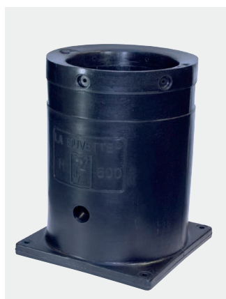
H 600 mm