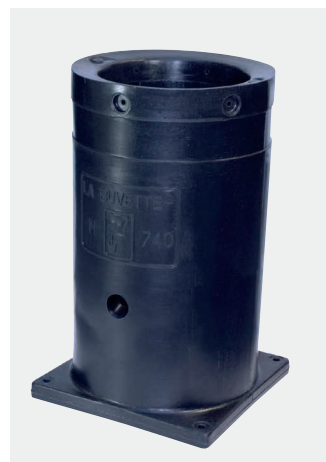
H 740 mm